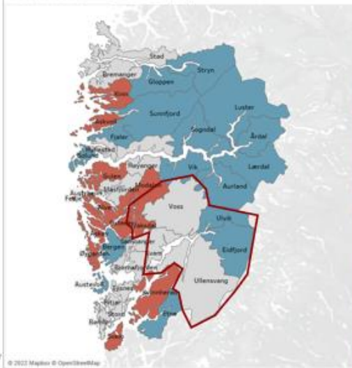
Kart med levekårsranking - Samla rangering